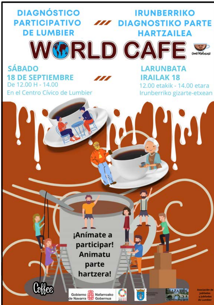
Cartel de la dinámica del World Café

Se considera conveniente generar un plan de comunicación/difusión sobre la vía del autoempleo entre la ciudadanía, crear medidas que atraigan a potenciales futuros emprendedores, dando a conocer desde el ayuntamiento las ayudas y ventajas fiscales de emprender en el ámbito rural, que les ayude en su decisión.