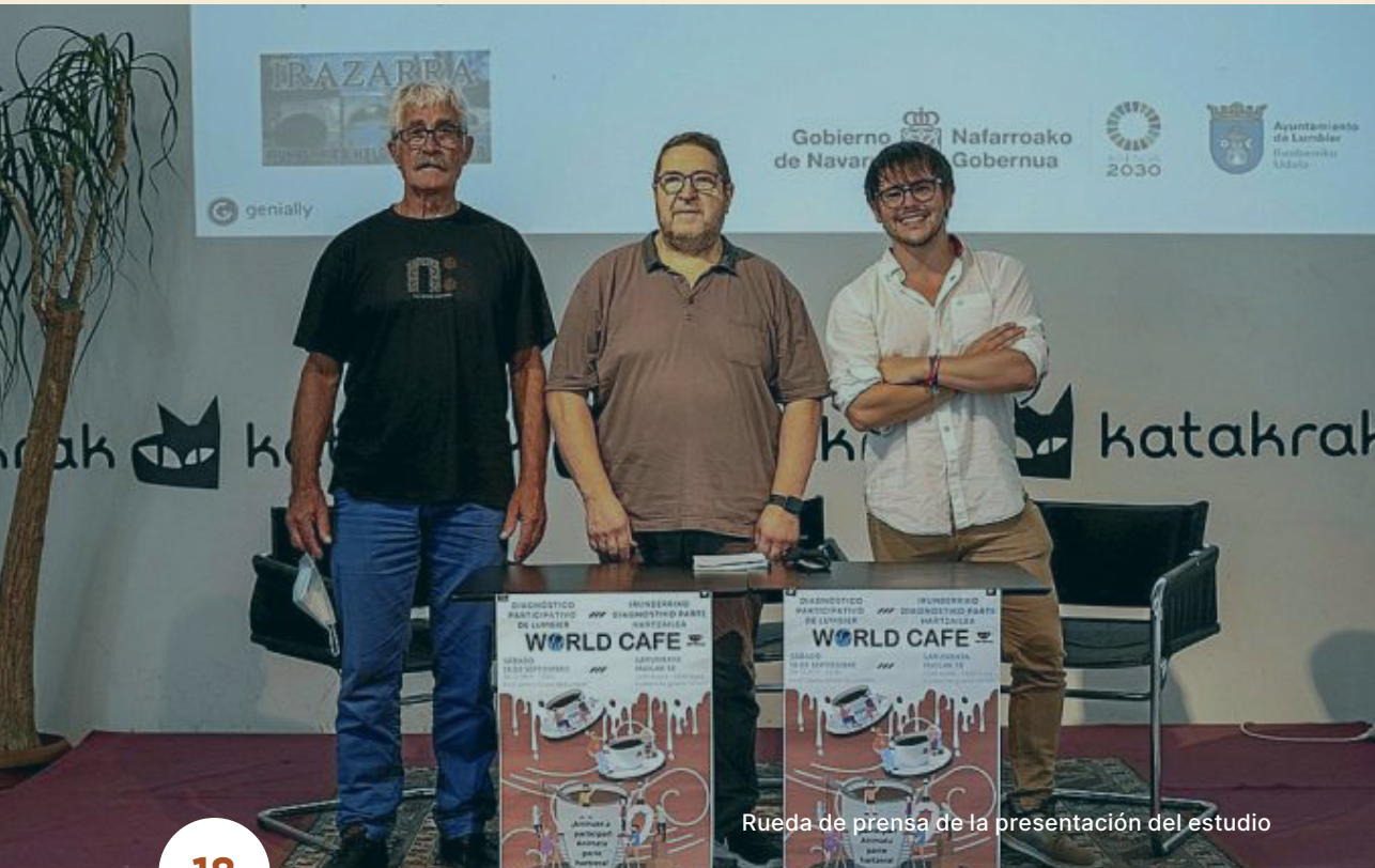
Rueda de prensa de la presentación del estudio

En la página www.irazarraelkartea.com puede consultar el informe final, y métodos de trabajo empleados en este proyecto.